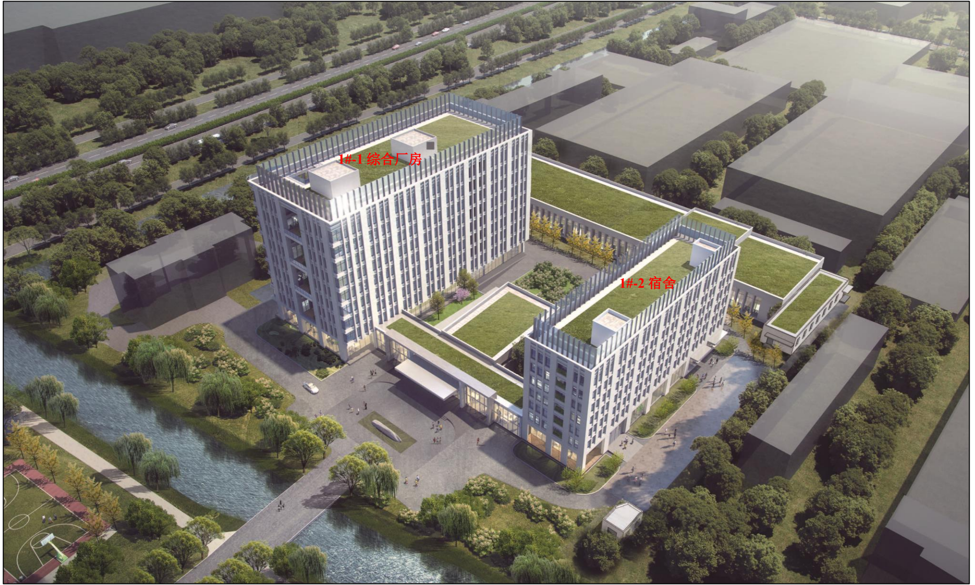
项目效果图-东北视角